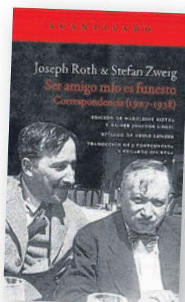
‘Ser amigo mío es funesto’

Autor: Michael Muhammad Knight Traducción: JMT & B. Orzos Editorial: Ginger Ape Books & Films Málaga, 2014 Páginas: 372