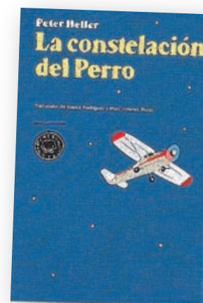
‘La constelación del Perro’

Autor: Joseph Roth, Stefan Zweig Traducción: J. Fontcuberta y Eduardo Gil Bera Editorial: Acantilado Barcelona, 2014; Páginas: 432