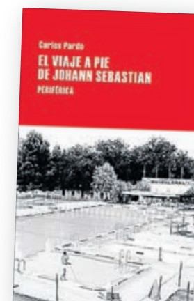
‘El viaje a pie de Johann Sebastian’